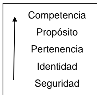
Figura 1. Niveles de desarrollo de la autoestima (Adaptado de Reasoner 1982)

El desarrollo de la autoestima en procesos de enseñanza de lenguas (Rubio 41-54) implica el garantizar la seguridad física y emocional del alumno en el aula, que los actos y el discurso del profesor deben ser coherentes, que el respeto y la retroalimentación positiva es fundamental, así como el tratamiento del error como parte integrante del proceso de aprendizaje de una lengua. El sentido de identidad tiene que ver con el desarrollo de la autoimagen que el alumno tiene de sí mismo. Para ello, el profesor de lenguas puede proponer actividades donde se puedan desarrollar esa conciencia de uno mismo desde modelos positivos y de aceptación.